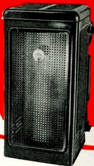
P 4 B 6