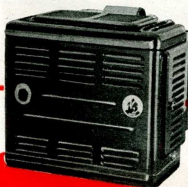
P 3 B 6