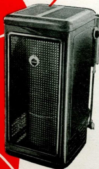
P 5 B 6