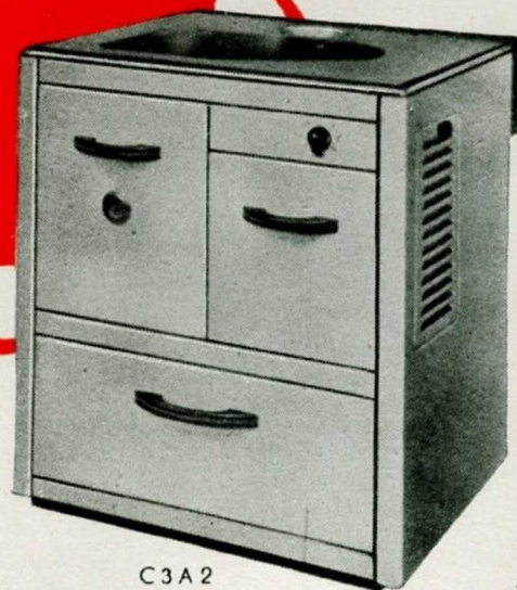
C 3 A 2

Une marque renommée Une qualité éprouvée