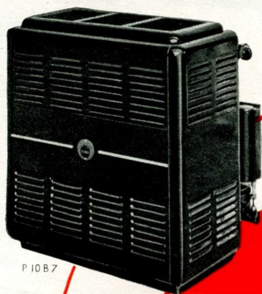
P 10 B 7